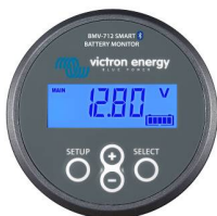
Bluetooth-Sensorik: BMV-712 Smart Batteriewächter