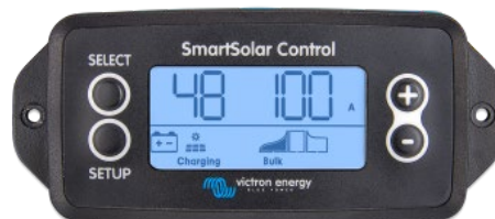
SmartSolar einsteckbares Display

Entfernen Sie einfach die Gummidichtung, die den Stecker an der Vorderseite des Reglers schützt und stecken Sie das Display ein.