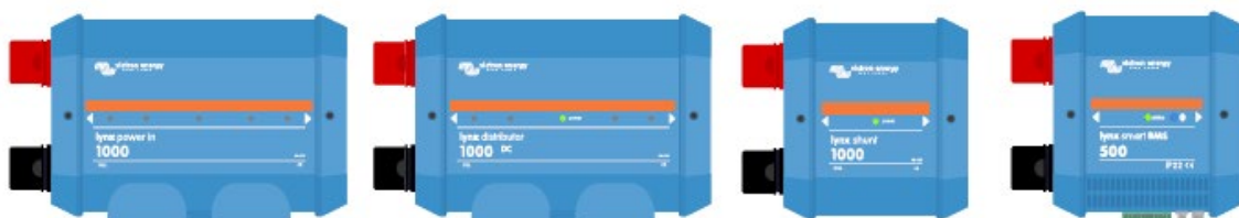
Die Lynx-Module: LynxPower In, Lynx Distributor, Lynx Shunt VE.Can und Lynx Smart BMS