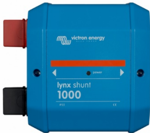
Lynx Shunt VE.Can