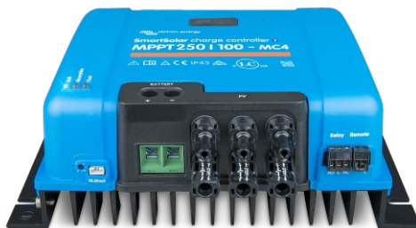
SmartSolar-Lade-Regler MPPT 150/100-MC4 ohne Display