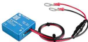
Bluetooth-Erkennung: Smart Battery Sense