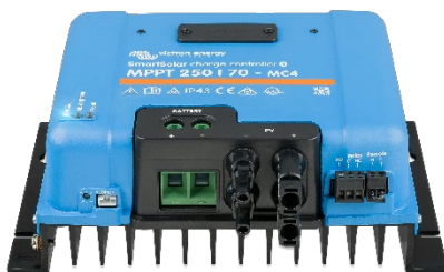
SmartSolar-Laderegler MPPT 250/70-MC4 ohne Display