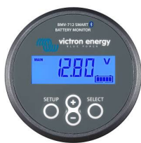
Bluetooth-Erkennung: BMV-712 Smart Battery Monitor