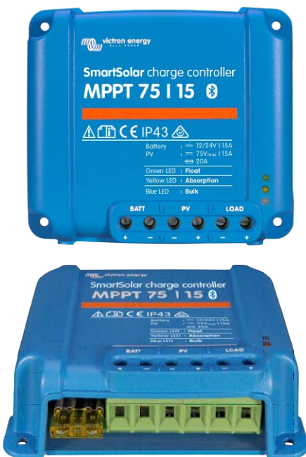
SmartSolar Lade-Regler MPPT 75/15