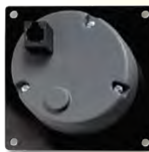
Ansicht von hinten